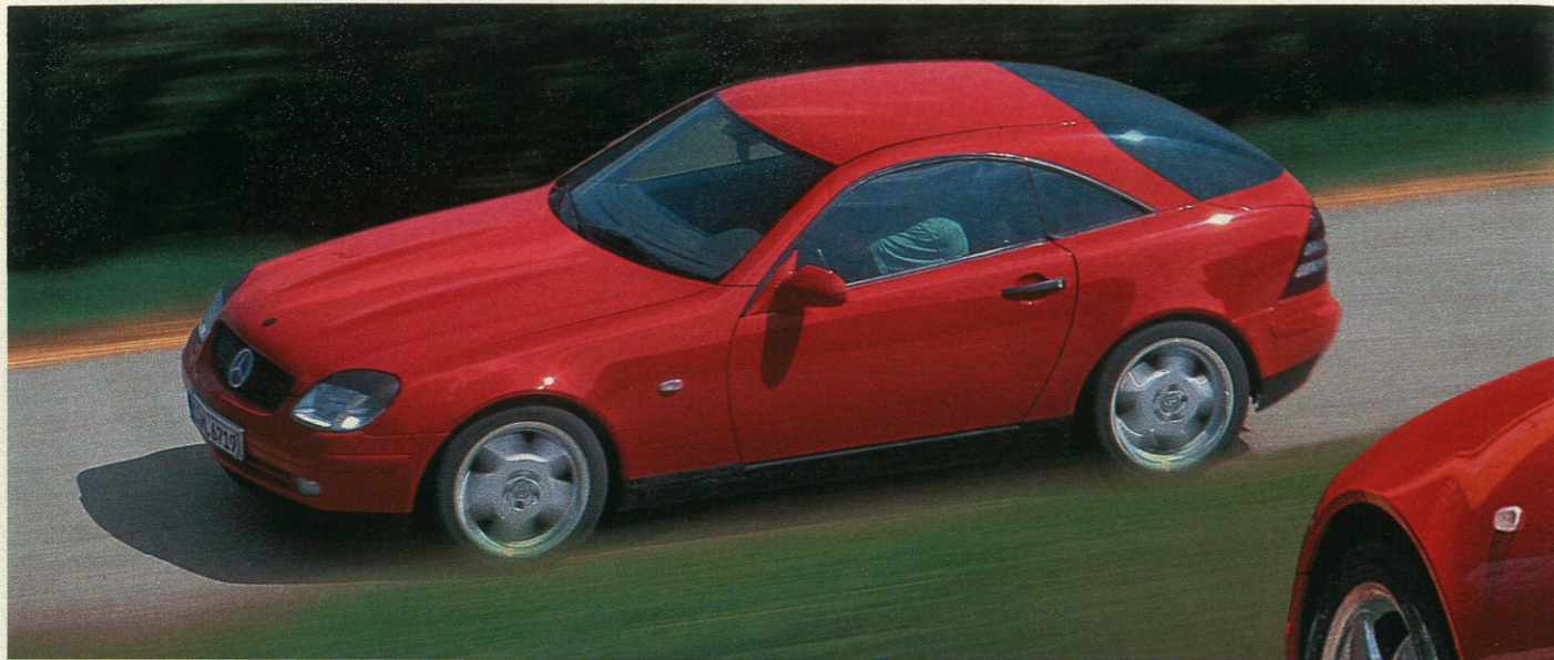
Die Computer-Retusche zeigt, wie der SLC in zwei Jahren auf den Markt kommen soll

nennen, doch nur 1,1 Prozent besitzt eins. Ähnlich verhält es sich bei den Coupés, die 7,2 Prozent des Bestands in Deutschland ausmachen, aber von 8,3 Prozent gewünscht werden. Vor allem junge Leute und Frauen zieht es mit Macht zu solchen Autos, so daß sich bereits neue Nischen in den Nischen auftun.