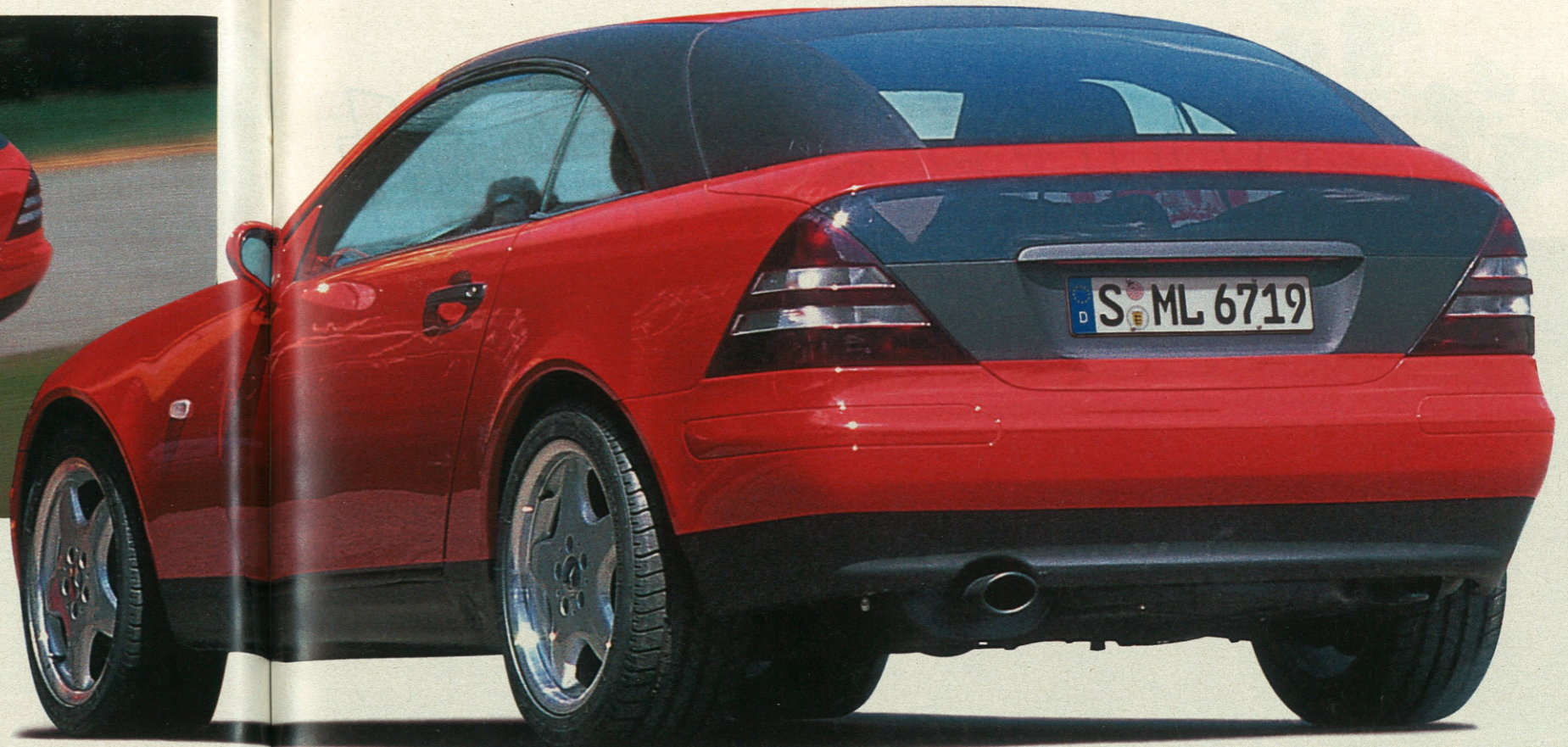
Neues Stilelement im SLC ist die schwarze Heckblende, deren oberer Streifen aus Glas besteht

Schöner Rücken, große Heckklappe: Barchetta Coupé